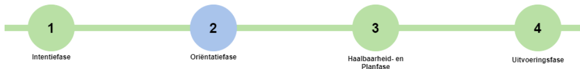
Figuur 1: progressiebalk Dashboard

Yme heeft de fasering van het ondersteuningsteam als vertrekpunt genomen (afbeelding). Dit procesmodel verdeelt wijkprocessen in vier fasen. Om de stand van zaken in wijken in beeld te brengen (monitoren) is behoefte aan verdere detaillering waarbij zowel de stand van zaken in elke wijk afzonderlijk in kaart kan worden gebracht, als de stand van zaken van het programma (alle wijken) als geheel. Yme heeft het monitoringsmodel uitgebreid met verschillende indicatoren 1 en mijlpalen 2 per fase of onderdeel. Aan de hand van interviews en literatuuronderzoek heeft hij de indicatoren en de mijlpalen per wijk geïnterviewd. Zijn bevindingen heeft hij weergegeven in een progressiebalk (figuur 1 en 2).